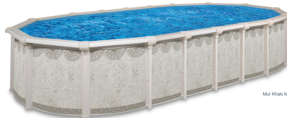
Mur Khaki Maya